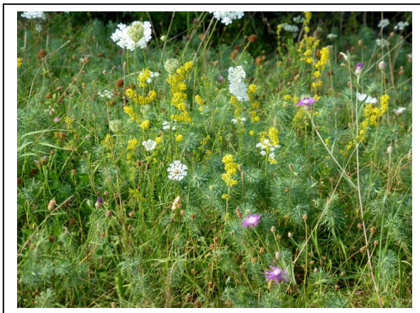
Abb. 7 Wilde Möhre, Zypressen-Wolfsmilch, Echtes Labkraut, Gewöhnliche Flockenblume

Standort IIb (Lä: 9° 2' 10" O, Br: 48° 47' 47" N)