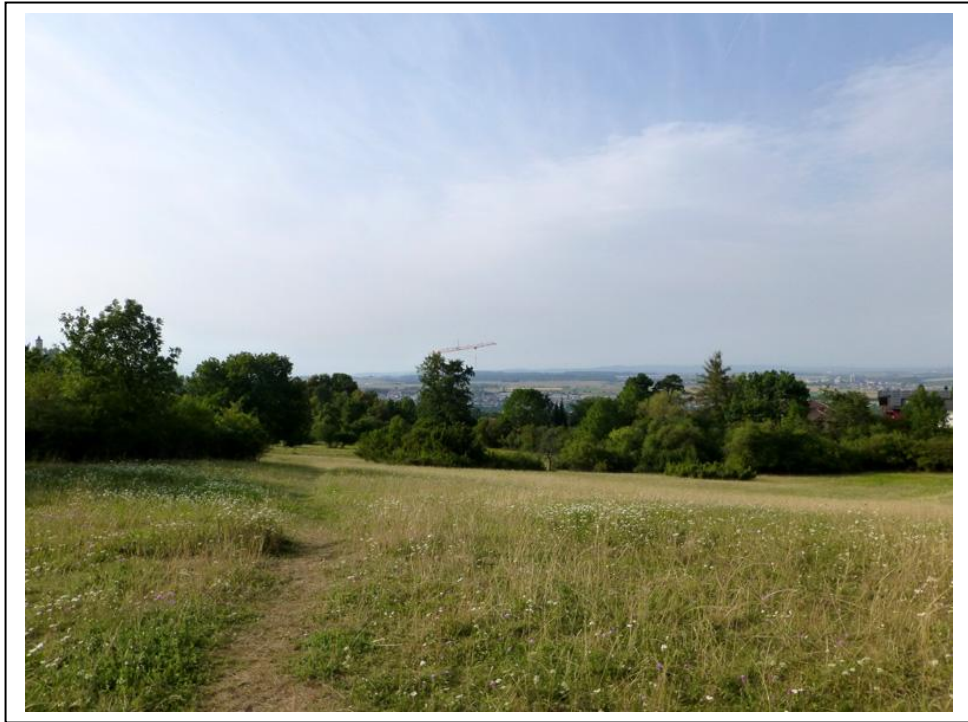
Abb. 5 Blick auf Teilbereich von Standort II in NNW-Richtung

her ragt eine bewaldete keilartige Fläche bis fast zur Mitte des Standorts. Nach Norden hin fällt das Gelände sanft ab.