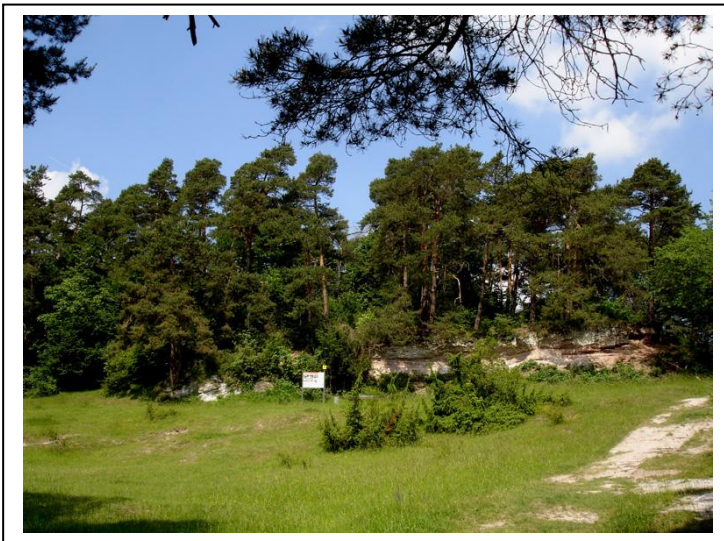
Abb. 2 Blick nach Norden auf den Steinbruch

Die Wiese, auf welcher der unten aufgeführte Artenreichtum beobachtet wurde, haben wir mit Standort I bezeichnet. Die Teilfläche umschließt ein Gebiet von ca. 50 Quadratmetern. Richtung Nordwesten fällt ein Gesteinsaufschluss ins Auge, vor dem sich eine Bank und eine