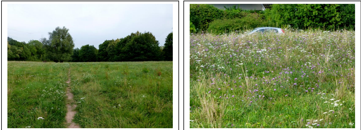
Abb. 13 und 14 Ampfergewächse, Gewöhnliche Flockenblumen und Schafgarbe bestimmen das Bild

Standort IV (Lä: 9° 02' 24" O, Br: 48° 47' 37" N)