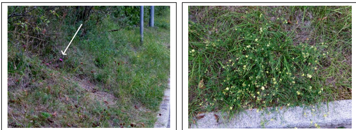
Abb. 11 und 12 Links Kartäusernelke, rechts Sichelklee

Standort III (Lä: 9° 02' 20" O, Br: 48° 47' 44" N)