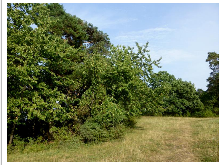
Abb. 6 Obstbäume im Bereich von Ila

Bei Ila handelt es sich um eine Art Lichtung im nordöstlichen Bereich, die an drei Seiten von Baumbeständen umgeben ist. Im Areal Ila fallen mehrere Obstbäume auf: Kirsch- und Apfelbäume sowie ein Walnussbaum. Beim zweiten Besuch waren Apfel- und Walnussbaum mit zahlreichen Früchten behangen. Auch sie sind wohl Relikte der oben erwähnten Kultivierungsversuche.