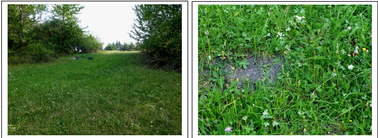
Abb. 9 und 10 Grüner Nordhang, trotzdem mit ausgetrocknetem Erdreich

Standort IIc mittig des Hangbereiches (Lä: 9° 2' 11" O, Br: 48° 47' 48" N)