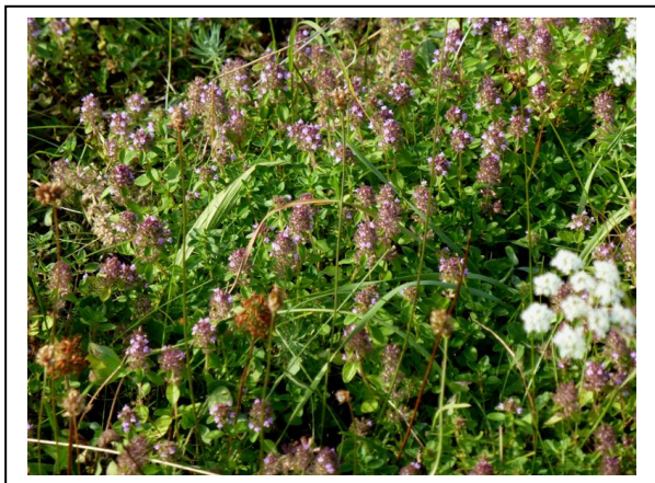
Abb. 8 Feld-Thymian

Bei so viel Trockenheit und verdorrten Pflanzen fiel beim zweiten Besuch der Bereich einer sattgrünen Fläche auf, die als IIc ausgewiesen wurde. Bei dieser Fläche handelt es sich um einen kleinen Nordhang, der sowohl nach Osten als auch nach Westen hin durch Bäume und Sträucher vor Sonneneinstrahlung und Wind geschützt ist. An manchen Stellen ist lehmiger, rissiger Boden zu erkennen. Für diesen Bereich ist nachzulesen, dass hier Mergel (s.o.) ansteht. Neben saftig grünem Gras waren hier blühender Knolliger Hahnenfuß, Kleiner Odermennig und Blutwurz zu finden.