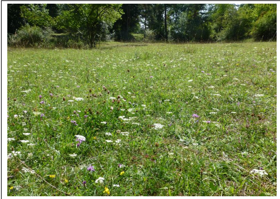
Abb. 4 Artenvielfalt am Standort I

Schafskot wies darauf hin, dass eine Beweidung durch Tiere, vermutlich Schafe in jüngerer Zeit stattgefunden hat. Fraßspuren an den Pflanzen waren allerdings nicht (mehr) zu erkennen. Zu erwähnen ist, dass dennoch auch beim zweiten Besuch viele Pflanzen blühten, teilweise auch unscheinbare Gewächse, die erst beim genaueren Hinschauen zu entdecken sind. Auf diesem Standort wurde die größte Artenvielfalt des gesamten Gebietes vorgefunden: