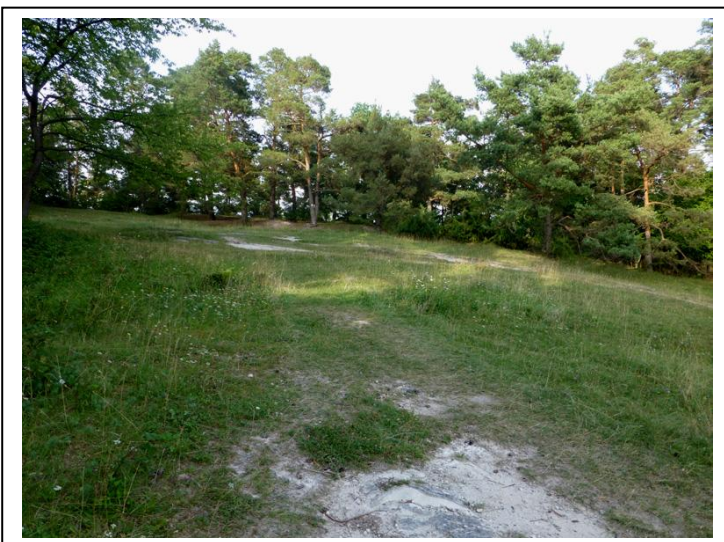
Abb. 3 Anstehendes Ausgangsgestein

Informationstafel befinden. Bei diesem handelt es sich um den auf der Wiki-Seite beschriebenen Stubensandstein. In alle anderen Richtungen ist dieser Standort vor allem durch Kiefern abgegrenzt.