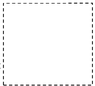
Zeichnung der Blätter